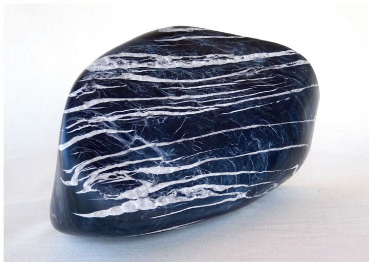
Pierre du Tseuzier (Valais, Suisse), 34 x 15 x 18,5 cm

Créer, c'est rester à l'écoute de se qui arrive à chaque instant... explorer les possibles